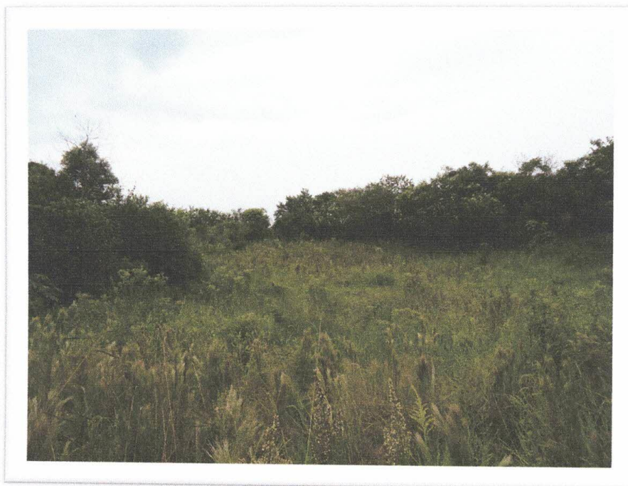
Fotografia 03 – Vegetação nativa localizada na propriedade