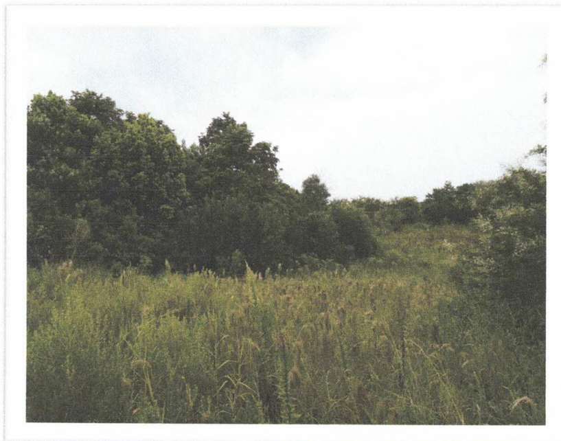
Fotografia 02 – Vegetação nativa localizada na propriedade