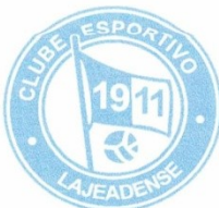
Clube Esportivo Lajeadense

De momento, agradecemos o apoio e contamos com a renovação para este ano.